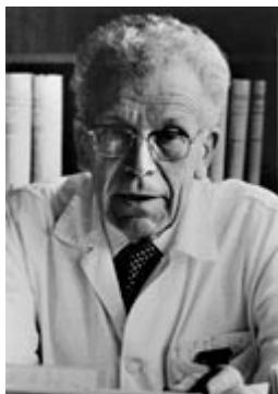
Dr. Hans Asperger

Se desconoce la causa del síndrome de Asperger, pero existen estudios de familias que sugieren una posible relación con el autismo. Las similitudes del trastorno de Asperger con el autismo respaldan la presencia de factores contribuyentes genéticos, metabólicos, infecciosos y perinatales.